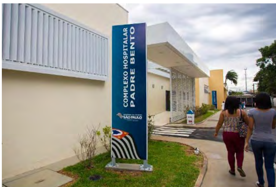
Complexo Hospitalar Padre Bento, em Guarulhos

Hospital e Maternidade Jesus, José e Maria (JJM) – Guarulhos | Hospital Municipal da Criança e do Adolescente – Guarulhos | Hospital Municipal de Urgências – Guarulhos | ADID (Associação para Desenvolvimento Integral de Down) | Casa de David – Tabernáculo espírita para excepcionais | Casas André Luiz – Guarulhos | Complexo Hospitalar Padre Bento de Guarulhos.