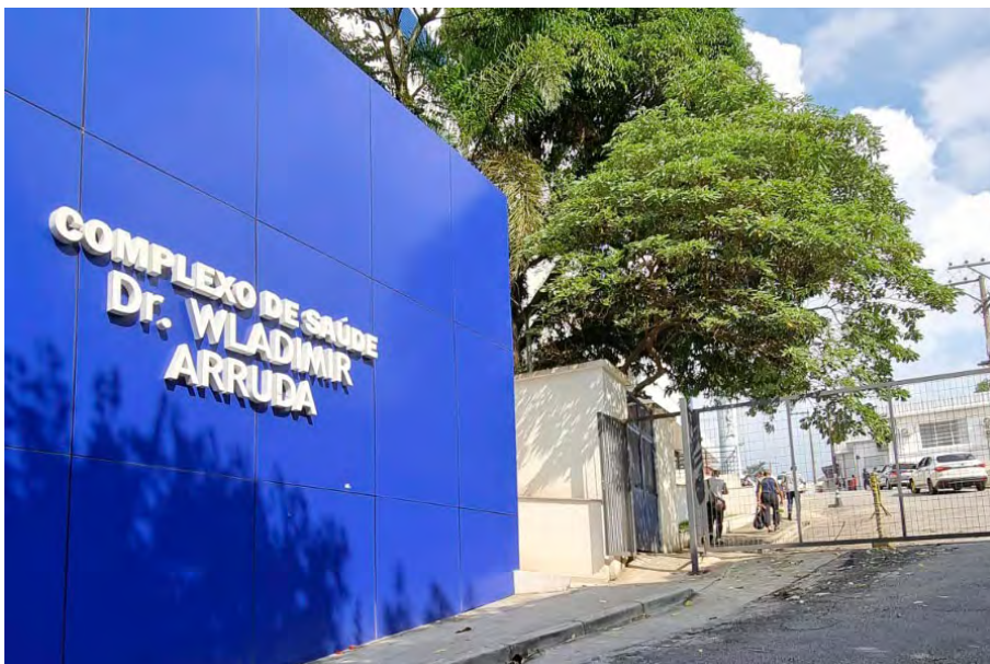
Hospital-Escola Wladimir Arruda

O curso de Medicina da Unisa mantém convênios com hospitais da rede pública municipal e estadual, bem como com outros complexos assistenciais privados filantrópicos. O portfólio inclui: