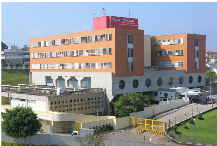
Hospital Geral do Grajaú

Conheça outros hospitais conveniados com a Instituição: Hospital Geral do Grajaú | Hospital Geral de Pedreira | Hospital Municipal de Parelheiros | Hospital Estadual de Vila Alpina | Instituto de Infectologia Emílio Ribas | Instituto Dante Pazzanese de Cardiologia | Hospital do Servidor Público Estadual | Hospital Municipal do Campo Limpo | Ambulatório Médico de Especialidades (AME) Interlagos | Hospital e Maternidade Interlagos | Instituto do Câncer Arnaldo Vieira de Carvalho.